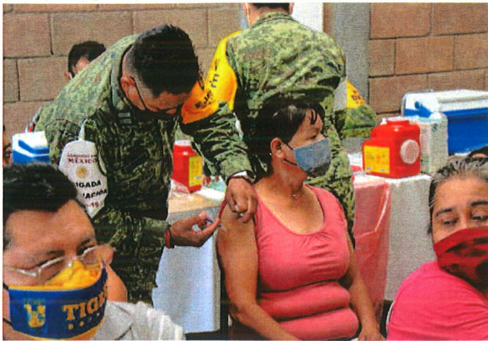
Elementos de Sedena apoyaron con la vacunación.